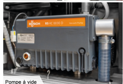
Pompe à vide