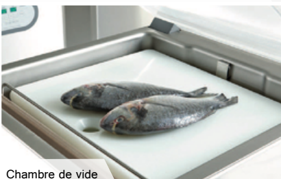
Chambre de vide