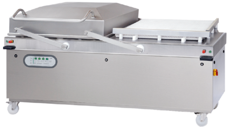
X-950 double cloche