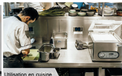
Utilisation en cuisine