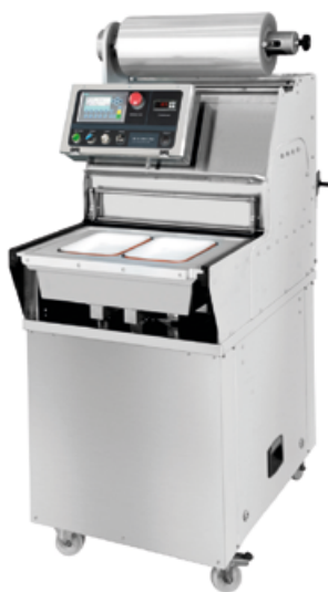
BS40 MAXI PRO