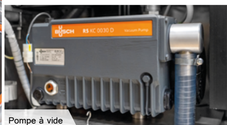
Pompe à vide

Version 1/2603 – Les images et les données présentées sont non contractuelles et n'engagent pas Technocarne.