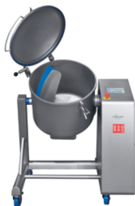
VM-60 à VM-220