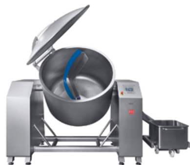
ESK-1200 à ESK-1500

Version 1 / 2603 — Les images et les données présentées sont non contractuelles et n'engagent pas Technocarne.