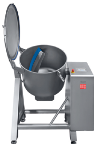
FM-300 à FM-500