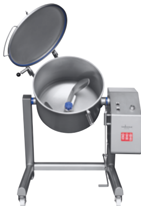
FM-60 à FM-250