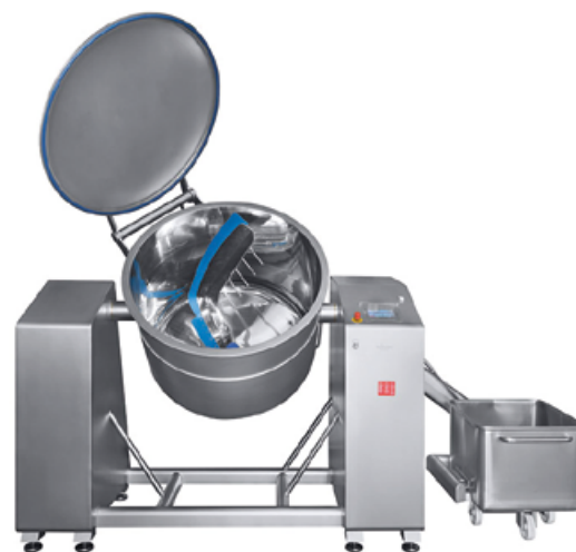
VM-750 à VM-1800