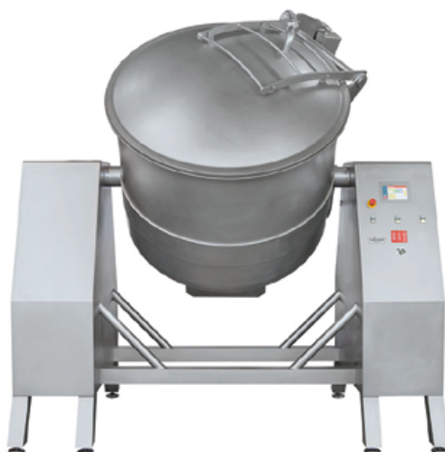
FM-750 à FM-1800