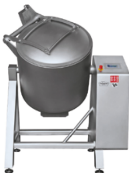
ESK-300 à ESK-400