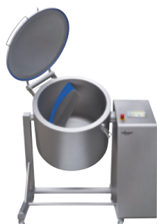
ESK-100 à ESK-250