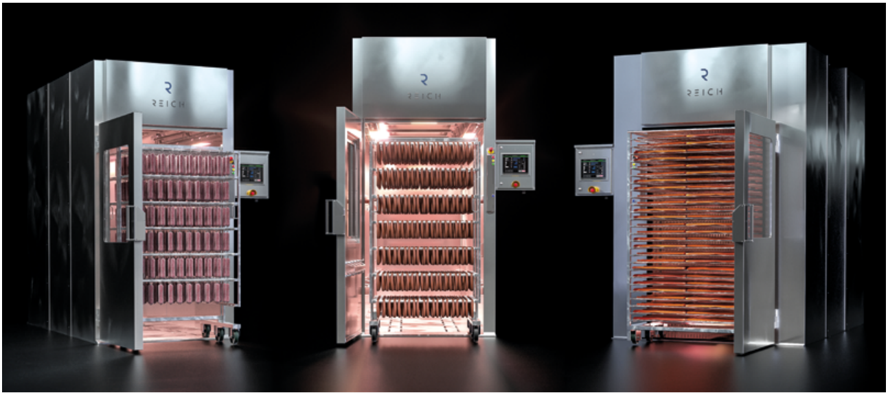
SÉRIE AIRMASTER : série UK | série IC | série UKQ